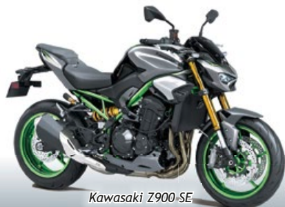
Kawasaki Z900 SE

Riesen Auswahl auf über 600 m 2 Ausstellungsfläche