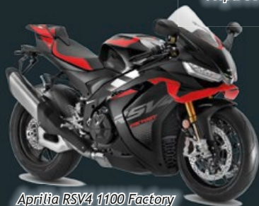
Aprilia RSV4 1100 Factory