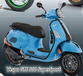
Vespa GTS 310 SuperSport