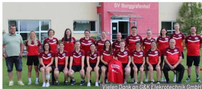
Vielen Dank an G&K Elektrotechnik GmbH

Leider hieß es in dieser Saison auch Abschied nehmen. Einige Spielerinnen haben unsere Mannschaft verlassen und hinterlassen sowohl sportlich als auch menschlich eine Lücke. Wir danken euch für euren Einsatz, die gemeinsamen Erlebnisse und die Zeit, die ihr Teil