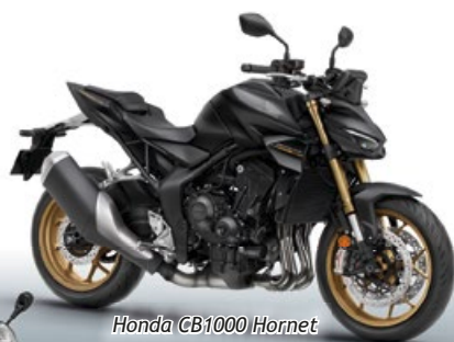
Honda CB1000 Hornet