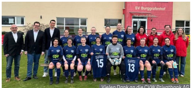
Vielen Dank an die CVW Privatbank AG