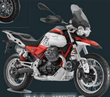
Moto Guzzi V85 TT